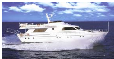
Углепластик для автомобилестроения и судостроения

Углепластик обладает уникальными свойствами и имеет большие перспективы в промышленности, строительстве и быту