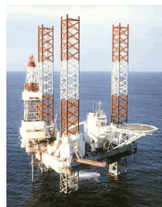
Углепластик для морских нефтяных платформ