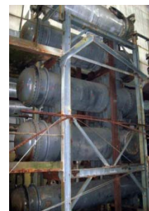
Углепластик для нужд химического машиностроения